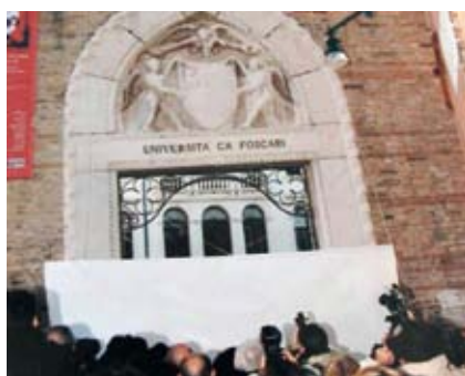
Portail Ca' Foscari de Venise, protection des parties en pierre avec ISOGRAFF.