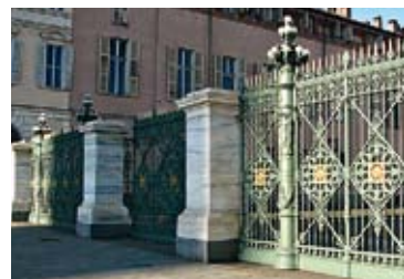
Palais Royal de Turin, protection de la grille (parties en pierre) et du plinthe avec ISOGRAFF.