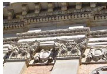
Tribunal regional eleitoral, Rio de Janeiro, protection des parties en pierre de la zone inférieure avec ISOGRAFF.